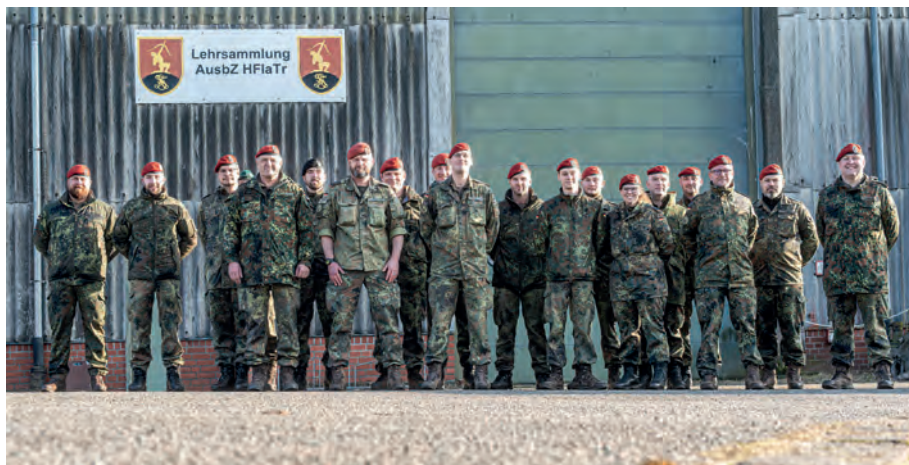
Bild 11 Der Aufstellungsstab in der Lehrsammlung der Heeresflugabwehrtruppe

wusste, wie sein Waffensystem aufgebaut war. Allerdings wurde damit auch eine hohe Anforderung an die Soldaten der Flugabwehr innerhalb der NVA gestellt.