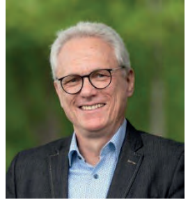
Hauke Hauschildt

Mein zweiter Besuch beim Leiter des Aufstellungsstabes der neuen Heeresflugabwehrtruppe hat einmal mehr als deutlich gemacht, mit welchen Herausforderungen die Truppe in Lüneburg zu kämpfen hat. Gleich ob bei der Infrastruktur, dem Personal oder auch dem Material: Die Herausforderungen sind immens. Und jeder, der Streitkräfte kennt, kann sich ausmalen, welche Kraftakte auch weiterhin zu vollziehen sind. Die Truppe bleibt dennoch zuversichtlich – „mühsam nährt sich das Eichhörnchen“.